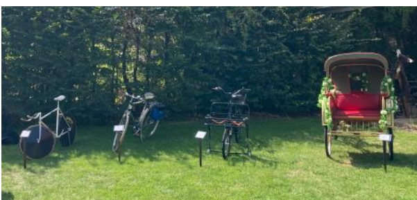
Begleitend zum jeweiligen Thema bereitet auch das Museum etwas vor: Hier historische Fahrräder beim „Museumscafé“ mit dem ADFC.

Dabei übernimmt das Museumsteam die Organisation, die Öffentlichkeitsarbeit und die Bewirtung. Der Kooperationspartner kann sich ganz auf die Vorstellung seiner Themen konzentrieren. Das Angebot kann von Museumsseite ergänzt werden, beispielsweise durch eine thematisch passende Ausstellung, eine pädagogische Aktion oder eine Fahrradtour.