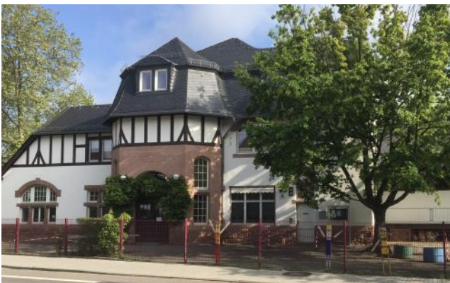
Bereits 40 Jahre wird der T.i.B. als Freizeit- und Begegnungsstätte genutzt.

Neben den im folgenden Programm bereits aufgeführten Veranstaltungen von der städtischen Jugendförderung, dem Fotoclub e. V., Bal Folk, Theaterinitiative am T.i.B. (TaT), Chaiselongue Kunst und Soziales und von den Naturfreunden e. V. werden sich das Internationale Frauencafé des Gleichstellungsbüros, der Hort am T.i.B. / Lernmobil e. V., Förderband e. V., Focus e. V. und Rencontres e. V. am Jubiläumsprogramm beteiligen und das 40-jährige Jubiläum des Treffs im Bahnhof gemeinsam feiern.