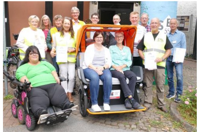
Zahlreiche Ehrenamtliche setzen sich mit der E-Rikscha für mehr Teilhabe von mobilitätseingeschränkten Menschen ein.