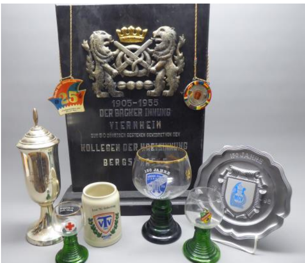
Pokale, Medaillen, Festschriften oder Filmaufnahmen stellen wichtige Zeugen des Vereinsleben dar. Sie sind unerlässlich, wenn es um die Erforschung und Vermittlung der Stadtgeschichte geht.

Um diese Aspekte zu dokumentieren, ist das