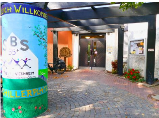
Eingang zur SBS 55+

Die SBS lebt vom ehrenamtlichen Engagement der Seniorinnen und Senioren. Auch heute noch wird die Begegnungsstätte von den Ehrenamtlichen in Selbstverwaltung geführt. Unterstützt werden die Ehrenamtlichen der SBS von den Mitarbeiterinnen des SeniorenBüros der Stadt Viernheim.