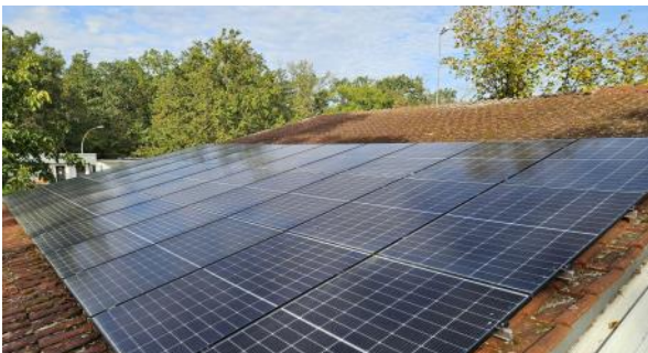
Auch der Vogelpark Viernheim hat die Chance genutzt und neben dem Papageienhaus auch auf dem Dach der Werkstatt eine PV-Anlage angebracht.

Vereine, die in den nächsten Monaten auf eigenen oder langjährig gepachteten Flächen eine Photovoltaik-Anlage (PV-Anlage) installieren, können sich für ein Förderprogramm der Stadtwerke Viernheim bewerben. Aufgelegt wurde es 2023 nach einem Beschluss des Aufsichtsrates. Zwei Projekte sind bereits mit dem Schrebergärtnerverein Viernheim e. V. und dem Vogelpark Viernheim e. V. erfolgreich umgesetzt worden.