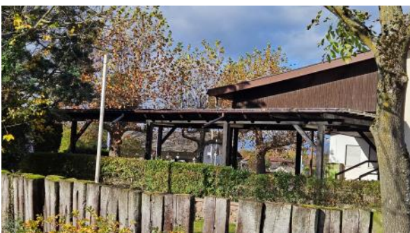
Auf dem Dach der Pergola des Schrebergärtnervereins Viernheim e.V. hat eine PV-Anlage Einzug gefunden.

Zwei weitere befinden sich in der Startphase. Abhängig von der Leistung der installierten PV-Anlage erhielten die Vereinsvertreter der Schrebergärtner und vom Vogelpark jeweils bis zu 15.000 Euro Fördergeld.