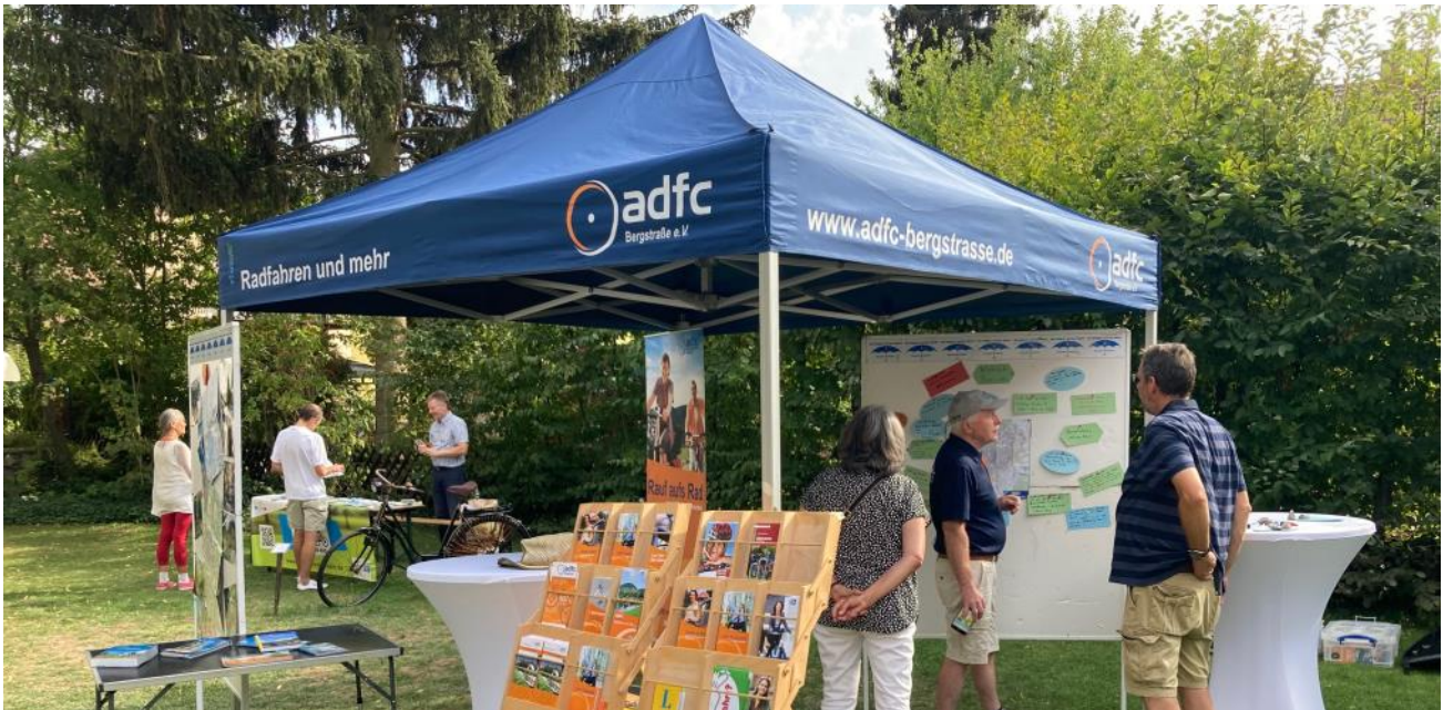
Der Allgemeine Deutsche Fahrrad-Club e.V. (ADFC) hat bereits das Angebot des Museums genutzt und sich im Rahmen des „Museumscafés“ gemeinsam mit dem städtischen Brundtlandbüro im Museumsgarten vorgestellt.