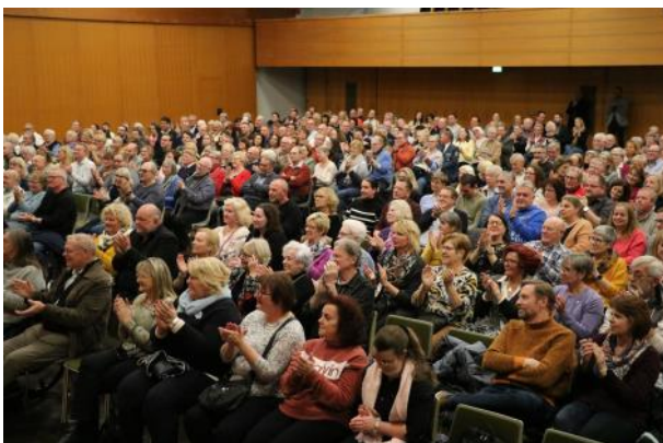
Stadt dankt freiwillig Engagierten mit einem Comedy-Abend im Bürgerhaus. Zahlreiche Ehrenamtliche folgten der Einladung des Bürgermeisters.

Tag für Tag, jedes Jahr aufs Neue schließen sich Menschen zusammen, um gemeinnützige Arbeit zu leisten - also Arbeit, die Allen in unserer Stadt zu Gute kommt. Wie hier in diesem Infobrief beschrieben, machen sich viele Mitglieder in Zukunftswshops Gedanken darüber, wie es mit dem Verein weitergehen kann. Man bildet sich weiter, um die Arbeit im Verein noch besser zu machen. Man diskutiert mit anderen Vereinsvorsitzenden über verschiedene Vereinsthemen. Man engagiert sich beim Freiwilligentag und bei vielen Gelegenheiten mehr. Das alles ist für die Stadt Grund genug, DANKE zu sagen.