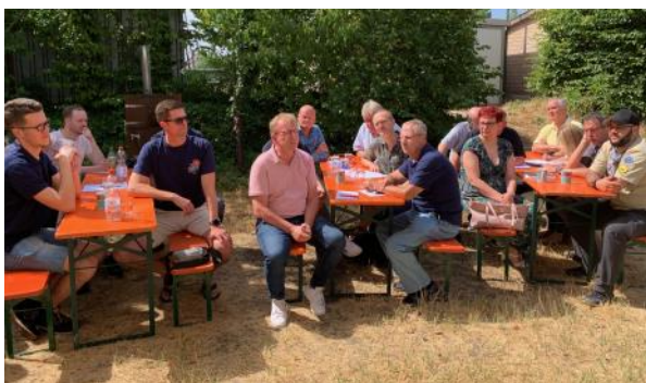
Die Viernheimer Pfadfinder waren am 2. Juli Gastgeber für die Vereinswelt aus Viernheim.

Vielen Dank für viele spannende Anregungen und Hinweise, die die Verwaltung aus der Vereinswelt bekommen hat. Zu allen Veranstaltungen sind die Vereinsvertreterinnen und -vertreter herzlich eingeladen.