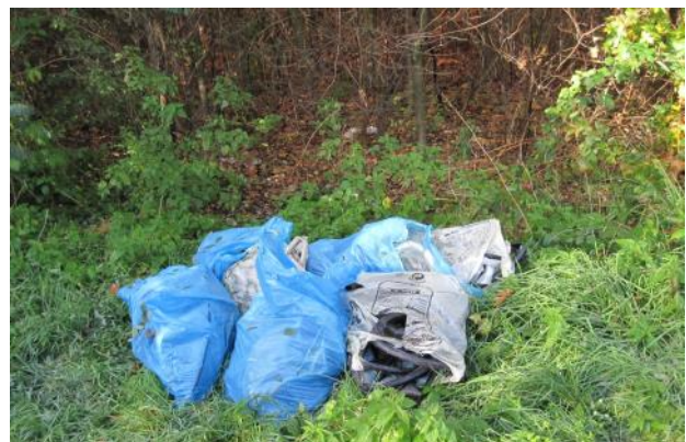
Gemeinsam wird den Müllbergen der Kampf angesagt.

Nach der regen Teilnahme im Jahr 2023 und der guten Zusammenarbeit mit der FFW Viernheim, findet beim Frühjahrsputz 2024 der Beginn und das Ende der Aktion auf dem Gelände der FFW Viernheim statt.