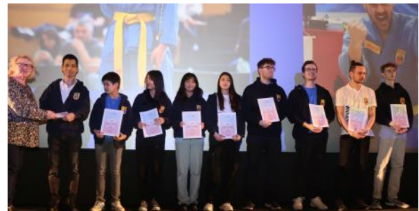
Sportlerehrung 2023: Ehrung des. 1. Kampfkunst & Sportverein Vovinam Vietvodao e. V.

Nach der Fastnacht ist der Monat Februar geprägt von Ehrungen sportlicher Erfolge des Vorjahres. Am Freitag, den 23. Februar, findet die Sportabzeichenverleihung im Ratssaal statt. Wer im Kalenderjahr 2023 die Leistungsanforderungen des Deutschen Sportabzeichens erfüllt hat, bekommt an diesem Tag die höchste Auszeichnung außerhalb des Wettkampfsports verliehen. Zwei Tage später stehen bei der Sportlerehrung am 25. Februar die Erfolge aus dem Wettkampfsport im Fokus. An diesem Vormittag werden im Kinopolis Einzelsportler*innen, Mannschaften sowie deren Trainer*innen geehrt, die im Jahr 2023 Erfolge gemäß der Ehrungskriterien der Stadt Viernheim erreicht haben.