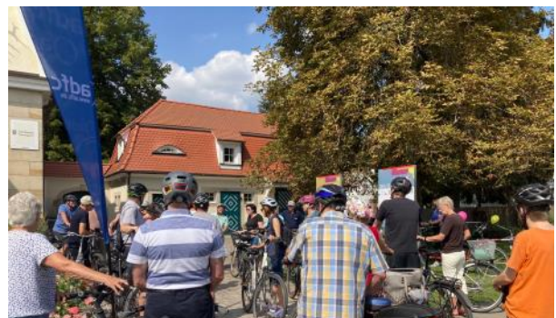
Gut angenommen wurde auch die historische Stadtführung per Rad.

Es entsteht ein einladendes Nachmittagsprogramm, das Interessierten die Gelegenheit gibt, sich in lockerer Atmosphäre bei Kaffee und Kuchen zu informieren und mit den Verantwortlichen ins Gespräch zu kommen.