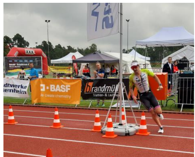
Der Viernheimer Triathlon in diesem Jahr war für Sebastian Kienle das vorletzte Rennen seiner Karriere.

und Alt wird. Gemeinsam mit Gastronomen werden auch die Vereine wieder die Gäste mit einem vielfältigen Speise- und Getränkeangebot verwöhnen. Auf mehreren Bühnen treten Vereine, Gruppen und natürlich auch Viernheimer Bands auf und laden zum Mitfeiern ein. Der neu gegründete „Musikertreff Viernheim“ (MTV) wird das Bühnenprogramm ebenfalls musikalisch gestalten. Auch das