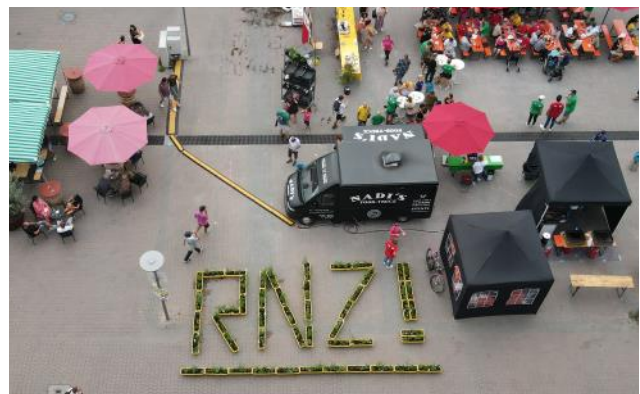
Helferfest auf dem Stadtplatz am RNZ.