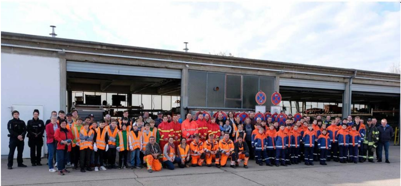
Zahlreiche Helfende machen Viernheim wieder „PUTZmunter“.