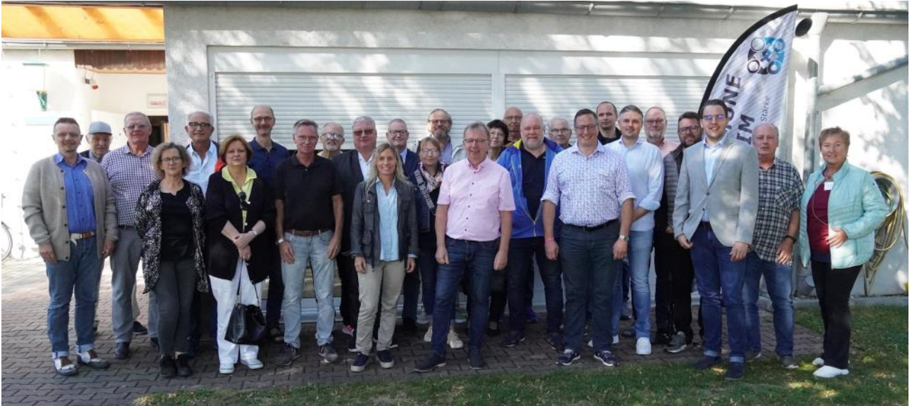
Zahlreiche Ehrenamtliche nutzten den Vereinsfrühschoppen im September, um sich beim Sportschützenverein 1953 e.V. Viernheim über aktuelle Themen zu informieren und Kontakte zu knüpfen.