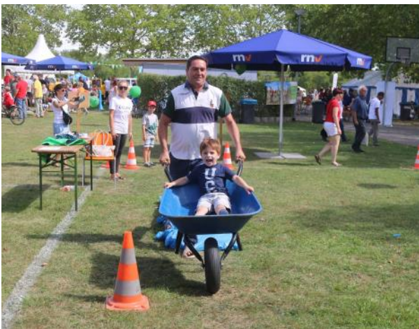
Der Familiensporttag verspricht Spiel und Spaß für die ganze Familie.

Den 1. September haben sich sicherlich bereits viele Bürgerinnen und Bürger, aber auch Vereine und Institutionen notiert. Denn am ersten Sonntag im September ist auch 2024 wieder Familien sporttag und dies bereits zum 14. Mal.