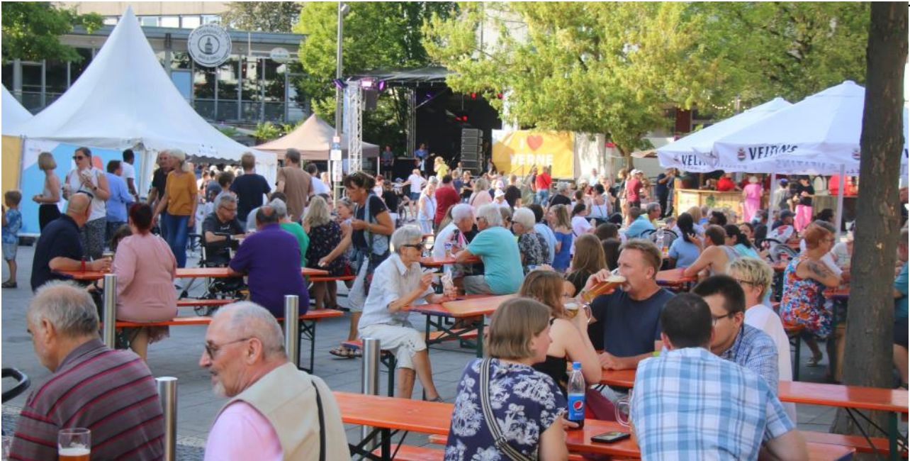
Beim 4nheimer Stadtfest können sich die Besucher auf gesellige Stunden in der Innenstadt freuen.