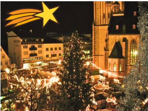
Viernheimer Weihnachtsmarkt auf dem Apostelplatz.

Ein weiteres Highlight wird wieder der 47. Viernheimer Weihnachtsmarkt vom 13. bis 15. Dezember bilden. Viernheimer Vereine und Gruppen locken mit allerlei Speisen und Getränken in die Innenstadt. Das bunte Bühnenprogramm sorgt jährlich für die passende musikalische Umrahmung. Das Kultur- und Sportamt freut sich über jede einzelne Anmeldung der Vereine, die die Innenstadt wieder in ein weihnachtliches Winterdorf verwandeln.